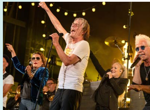
Uofficiel åbning af Aarhus Festuge - GNAGS' Aarhushistorier