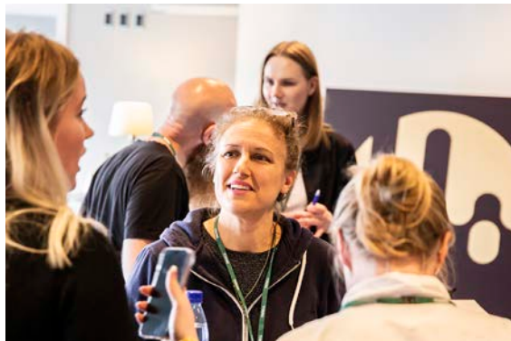
Meet The Music Supervisors – speed meetings – SPOT+ 2022