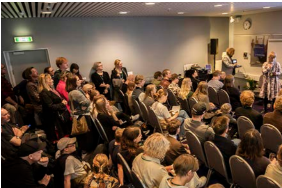
Paneldebatter – SPOT+ 2022