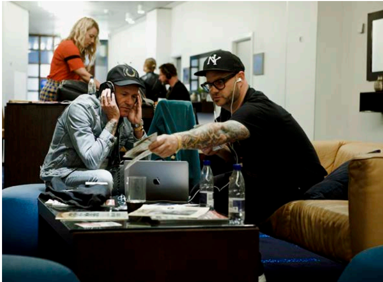
Networking – SPOT+ 2022