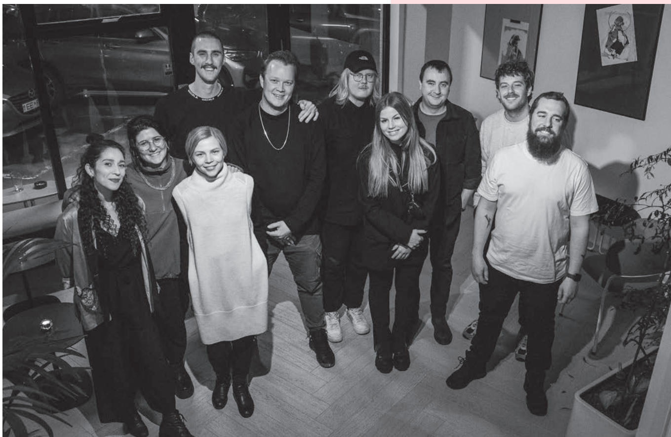
Det første European Music Business Task Force team - 12 branchefolk fra Danmark, Estland, Finland, Island, Holland, Norge, Tyskland og England.

“Resten af verden skeler til Aarhus, når der skal udvikles noget nyt inden for musikbranchen.”